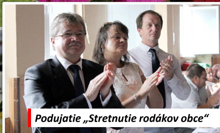
Podujatie „Stretnutie rodákov obce“