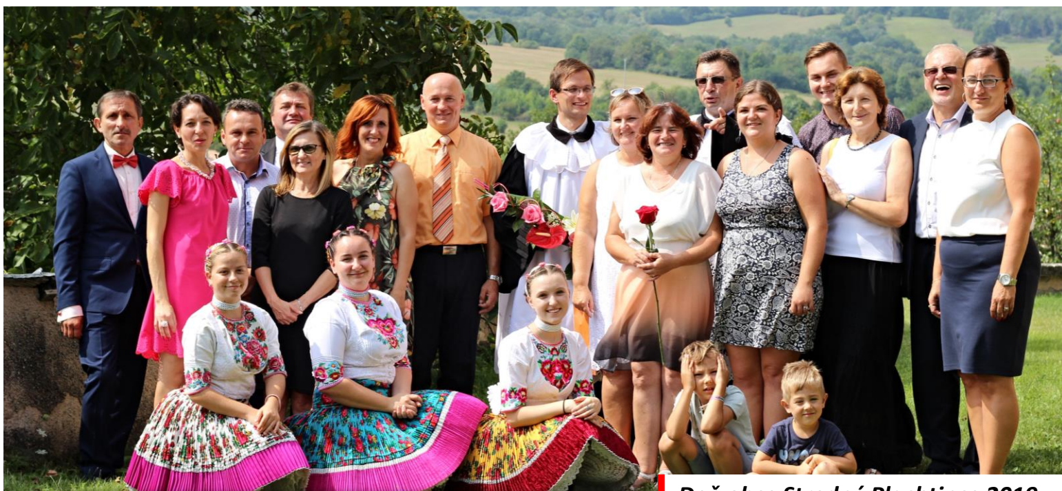
Deň obce Stredné Plachtince 2019

Obecné noviny Stredné Plachtince • Štvrťročník • Nepredajné