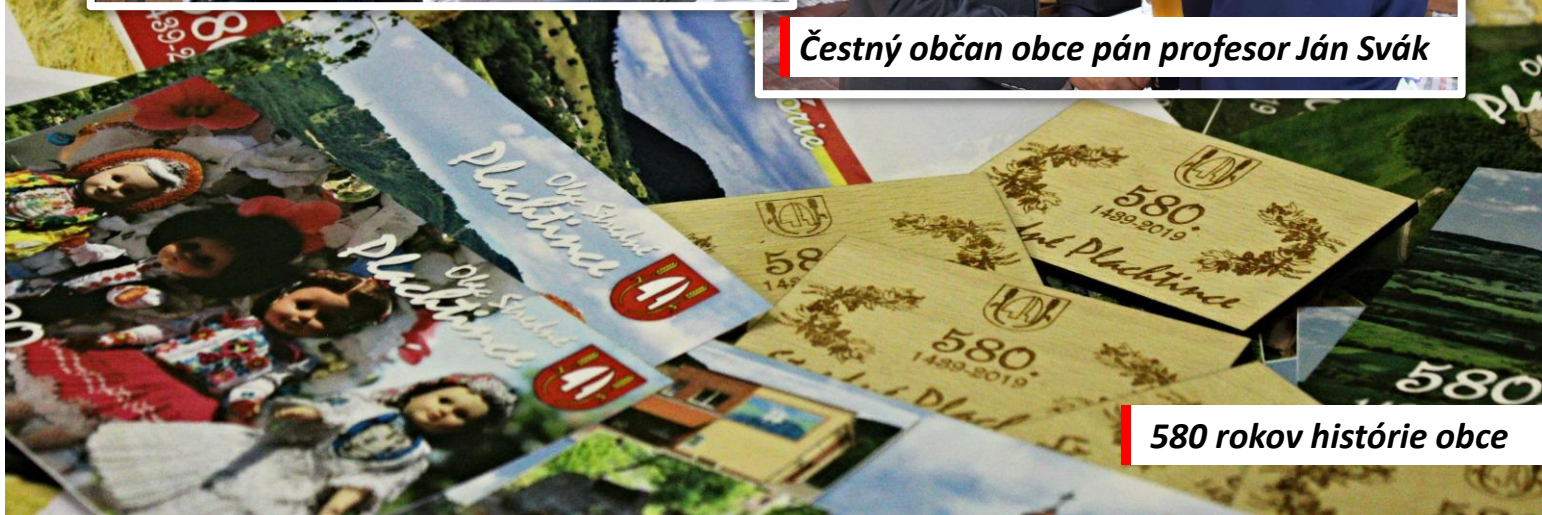
580 rokov histórie obce