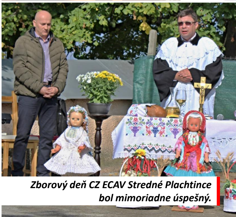
Zborový deň CZ ECAV Stredné Plachtince bol mimoriadne úspešný.