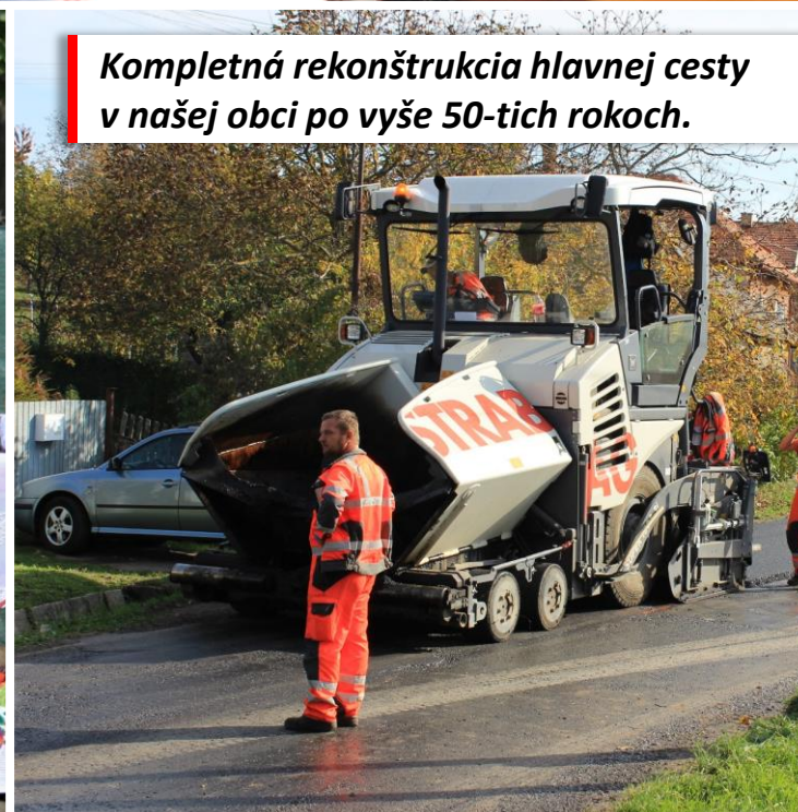
Kompletná rekonštrukcia hlavnej cesty v našej obci po vyše 50-tich rokoch.