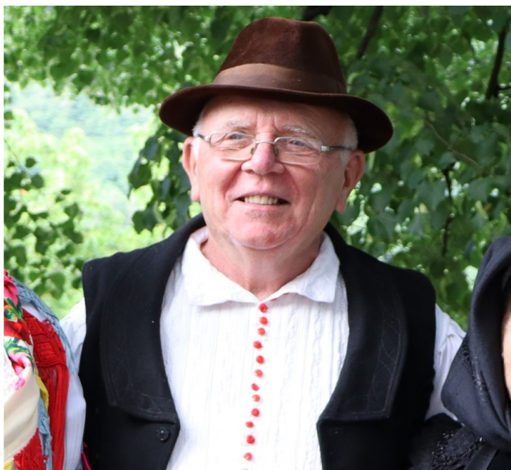
Autor článku | Juraj MATIAŠ

Temto vinš ma naučila moja starká Kukanova. Tak ja si takto ako d'ieťa pamätám na Kračúm.