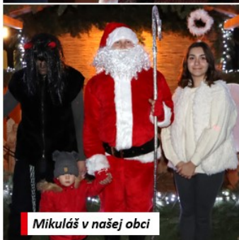
Mikuláš v našej obci