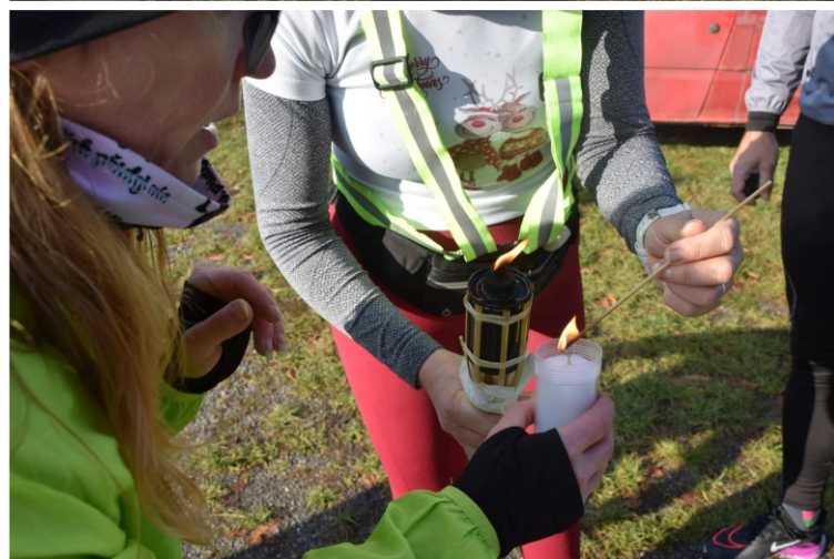
Autor článku | Mgr. Ľubica SÝKOROVÁ