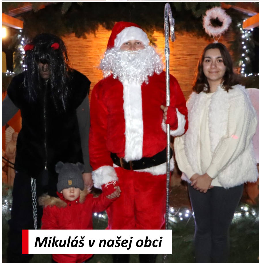
Mikuláš v našej obci