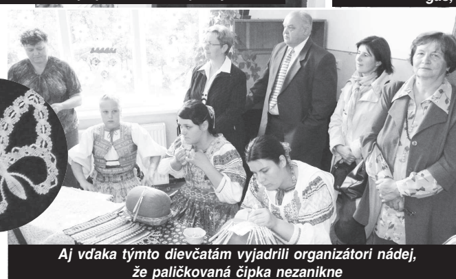
Aj vďaka týmto dievčatám vyjadrili organizátori nádeje, že paličkovaná čipka nezanikne