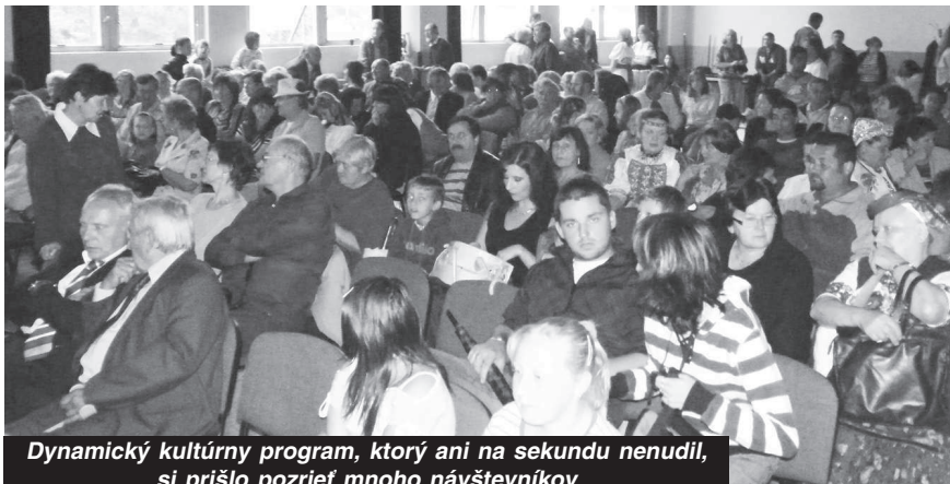
Dynamický kultúrny program, ktorý ani na sekundu nenudil, si prišlo pozrieť mnoho návštevníkov