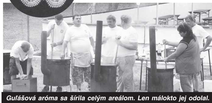
Gulášová aróma sa šíri celým areálom. Len málokto jej odolá.