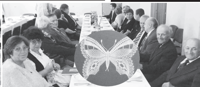
Na slávnostnom obecnom zastupiteľstve boli ocenení viacerí obyvatelia i rodáci, ktorí sa zaslúžili o rozvoj obce a šírenie jej dobrého mena